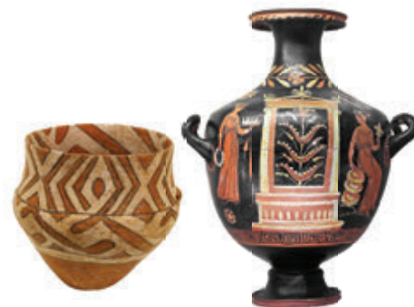
7. ábra – Kerámiaedények