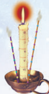
3. ábra – Időbeosztásos gyertya