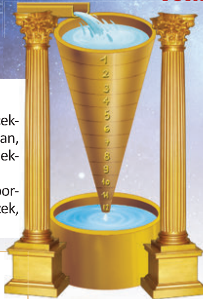
1. ábra – Vízóra