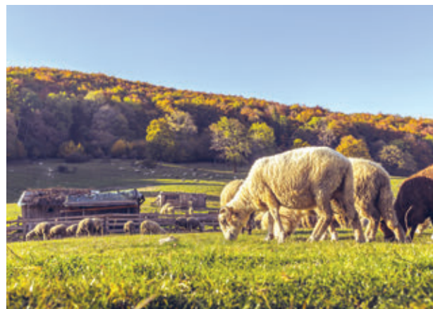
6. ábra – Juhtenyésztés