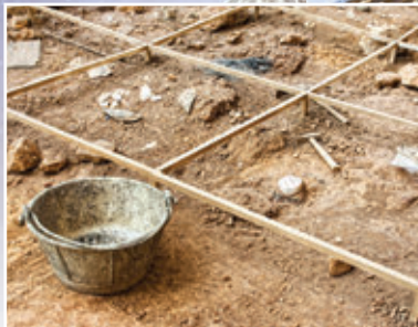
1. ábra – Régészeti ásatás