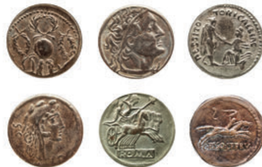
6. ábra – Pénzérmék