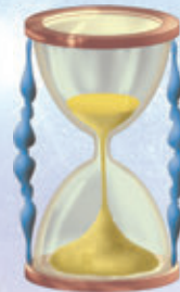
2. ábra – Homokóra