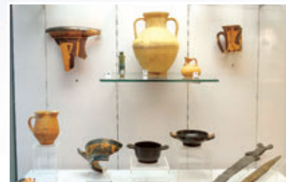
4. ábra – Történelmi értékű tárgyak