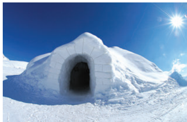
5. ábra – Sarkvidéki lakóhely

Az emberek életét minden időben befolyásolta a földrajzi környezet és az éghajlat. Folyamatosan alkalmazkodniuk kellett a természeti adottságokhoz, a háztartás, a foglalkozások különbözőnek a domborzat, az éghajlat és a víz függvényében (5-6. ábra).