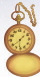
4. ábra – Mechanikus óra