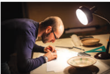
3. ábra – Régész a laboratóriumban