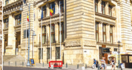
2. ábra – Románia Nemzeti Történelmi Múzeuma, Bukarest