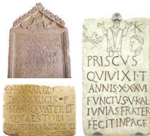
5. ábra – Feliratok

A történelmi források felkutatása a régészek feladata, ők előbb elvégzik az ásásokat, majd laboratóriumban elemzik a leleteket (1. és 3. ábra). Az így megszerzett információkat a történészek rendelkezésére bocsájtják. A legtöbb feldolgozott leletet múzeumban, könyvtárban vagy levéltárban őrzik (2. és 4. ábra).